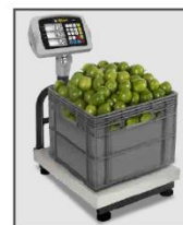
Barandal de carga que ayuda a posicionar la mercancía en la plataforma