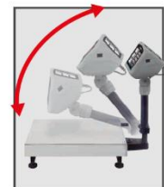
Plataforma con sistema plegable

Encuentra nuestros productos en el siguiente enlace: puntosdeventa.com.sv/marca/77/rhino